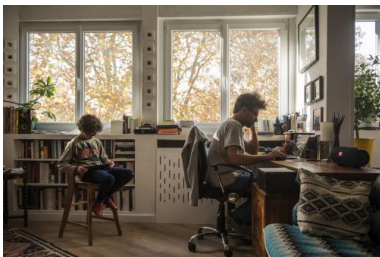
Une famille à Toulouse, novembre 2020.

La détermination de l'État à déployer la 5G est très compréhensible. L'objectif est de démultiplier le débit d'Internet pour radicaliser l'addiction d'un grand nombre de gens au numérique et pour mettre en relation des milliards d'objets connectés. Seulement, il y a un imprévu : une partie de la population se méfie de ce projet, à tel point que certains politiciens se prononcent contre – fait exceptionnel. Même des personnes qui n'avaient jusqu'ici aucun problème avec l'usage intensif des technologies trouvent que cela va trop loin, à l'image du mouvement des «gilets jaunes», largement tributaires des réseaux sociaux mais au sein desquels des mots d'ordre anti-5G étaient apparus.