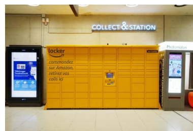
Point de retrait Amazon à la gare du Nord (Paris), novembre 2020.