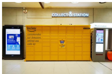
Point de retrait Amazon à Paris, novembre 2020.